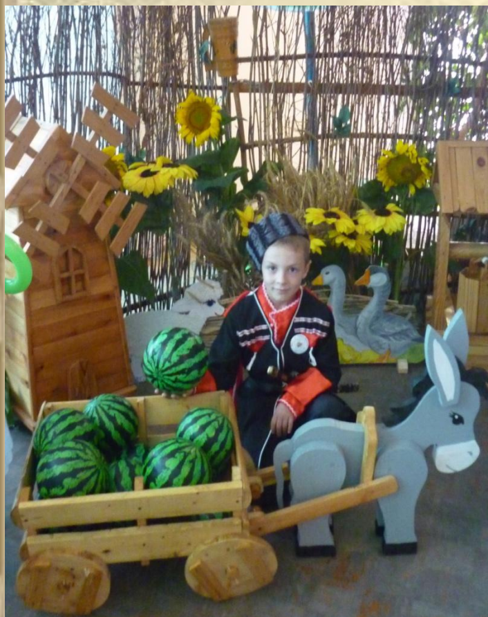
Центр истории и культуры казачества